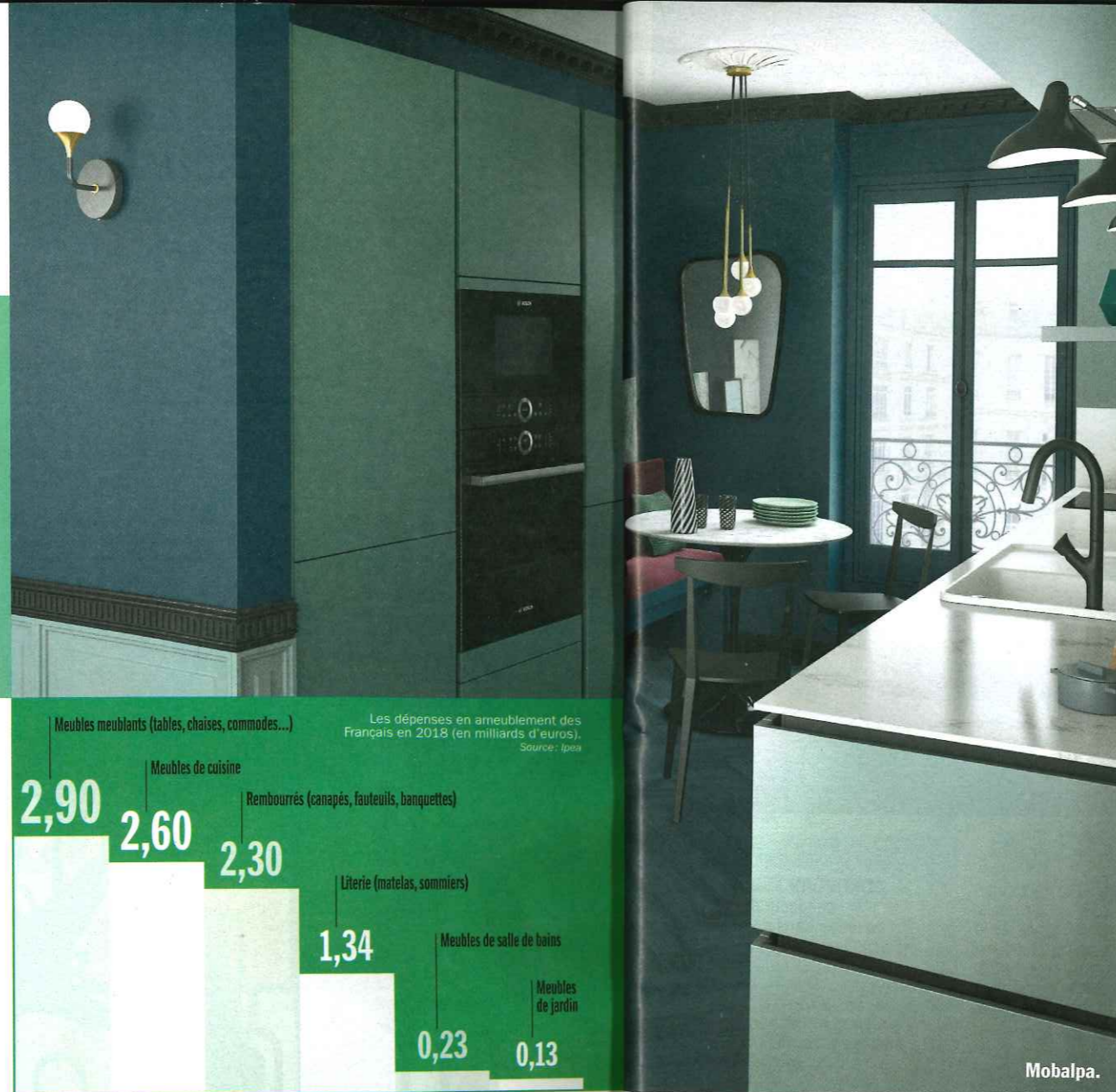
Mobalpa. SP MOBALPA

Les marques ne se contentent plus de vendre leurs produits. Elles cherchent aussi à proposer toutes sortes de services à forte valeur ajoutée.